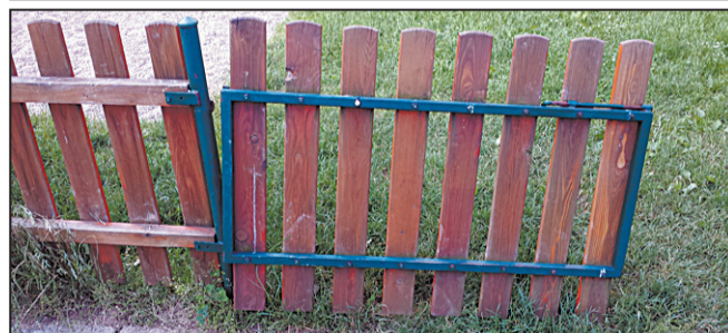
Malé dětské hřiště s vyvrácenou brankou nedaleko školy Nad Plovárnou.

JIHLAVA (pab) - Vyvrácená branka u plotu, vysoká tráva a dlouho nenatíraný plot. Takovýto obrázek skýtá malé dětské hřiště mezi řadovkami, nedaleko školy Nad Plovárnou.